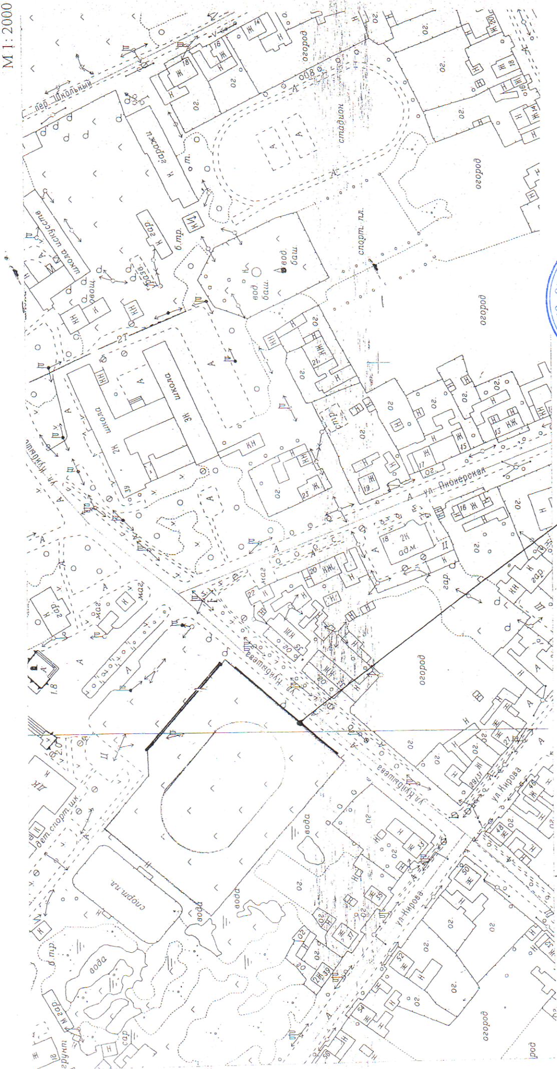
Схема размещения рекламных конструкций в р.п. Пышма ул. Куйбышева, 40